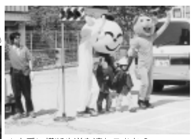
▲上手に横断歩道を渡れるかな？(交通安全教室)