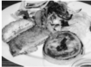
▲玉葱のピザ風フライ、玉葱のサンドイッチ、玉葱のサラダ

多く、辛みより甘みがあるのが特徴です。この辛み成分には、血液や動脈硬化を予防する働きや疲労を回復させる働きもあります。また甘み成分には整腸作用もあります。年間を通して食卓に登場する脇役ですが、多めに使って主役に見ませんか。