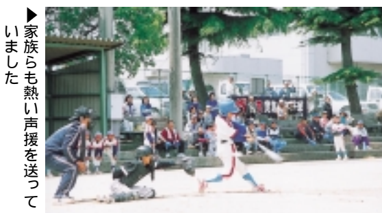
▶ 家族らも熱い声援を送っていました

5月5日、賀集スポーツセンターグラウンドで『南淡ライオンズクラブ杯少年野球大会』が開催され、賀集少年野球クラブが優勝しました。当日、南淡町の4チームがトーナメントで熱戦を繰り広げ、たくさんの家族づれから熱い声援を受けていました。試合結果は、優勝・賀集少年野球クラブ、準優勝・北阿万少年野球クラブ、3位・阿万少年野球クラブ、4位・福良少年野球クラブ。