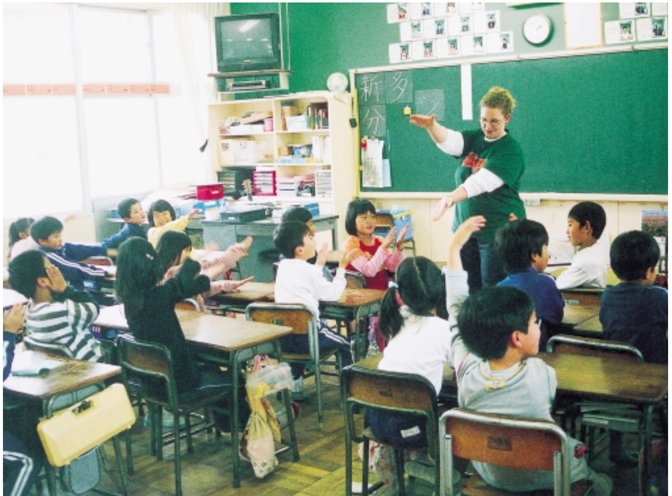
グッド モーニング 「Good morning!」で始まる賑やかな教室（賀集小学校）〔関連記事2ページ〕