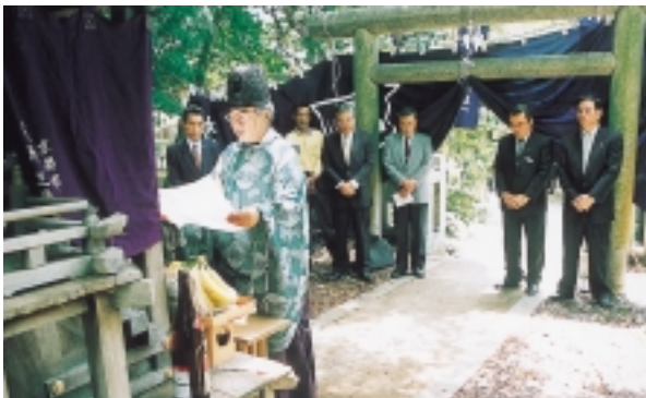
▶そうめんを奉り、神事が行われました

当日、素麺業組合員や製粉業者、資材業者、観光協会長、商工会長ら約30人が参列し、そうめんの神様に祈願しました。