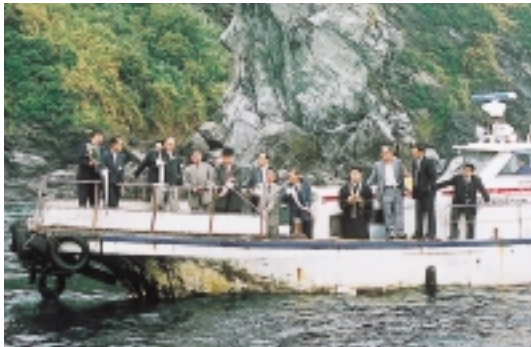
▶体長約一メートルのハモを放流する関係者