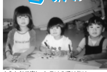
▲みんなで楽しく、こいのぼり作り