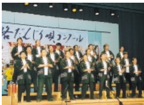
▶ 優勝の栄冠を手にした賀集町内会、外題：仮名手本忠臣蔵六段目 勘平切腹の段

このコンクールには淡路島内から39団体が参加し、どの団体も真剣な面持ちで日ごろの練習の成果を力いっぱい歌い上げました。